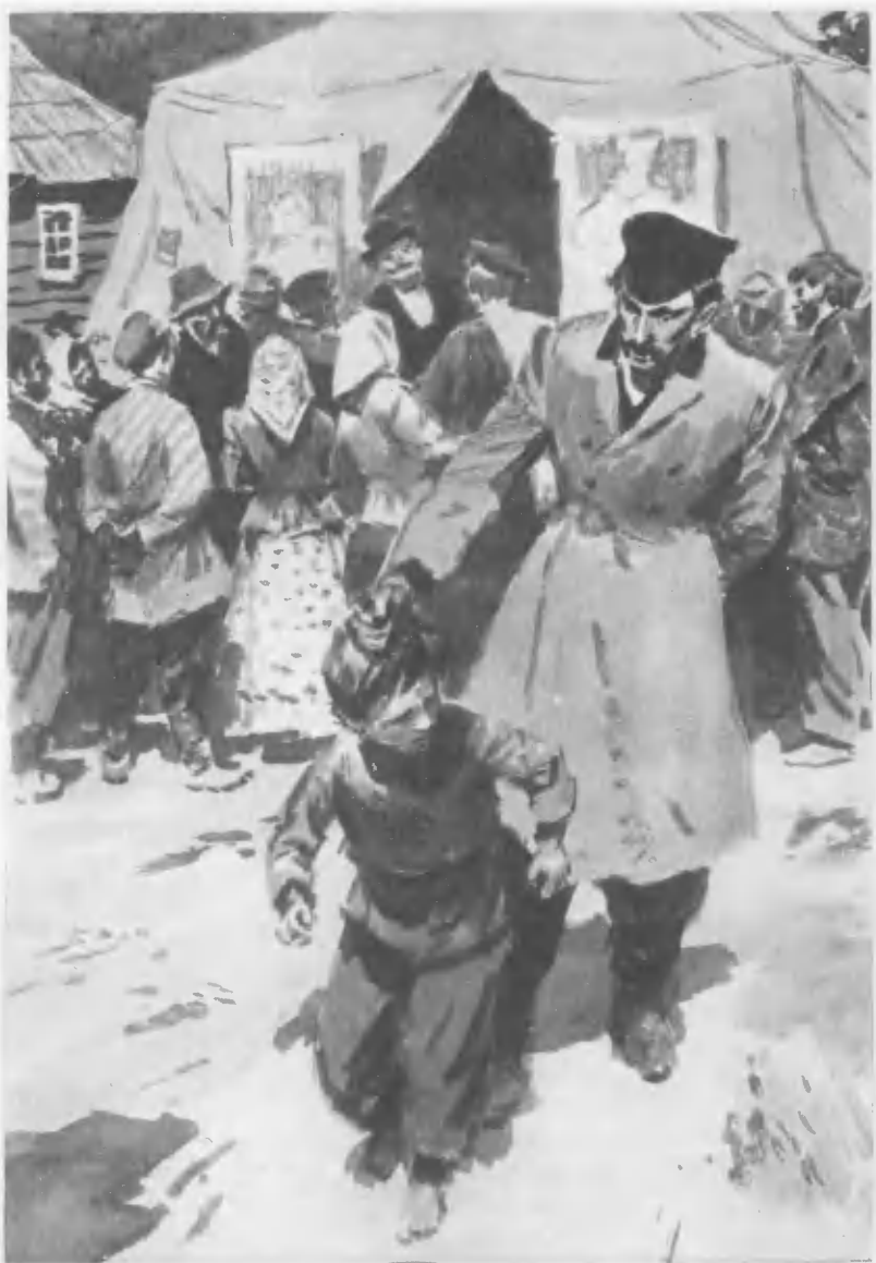
«ПРИИСКОВЫЙ МАЛЬЧИК» (стр. 101).