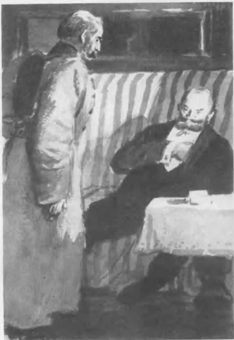
«СИБИРСКИЕ ОРЛЫ» (стр. 10).