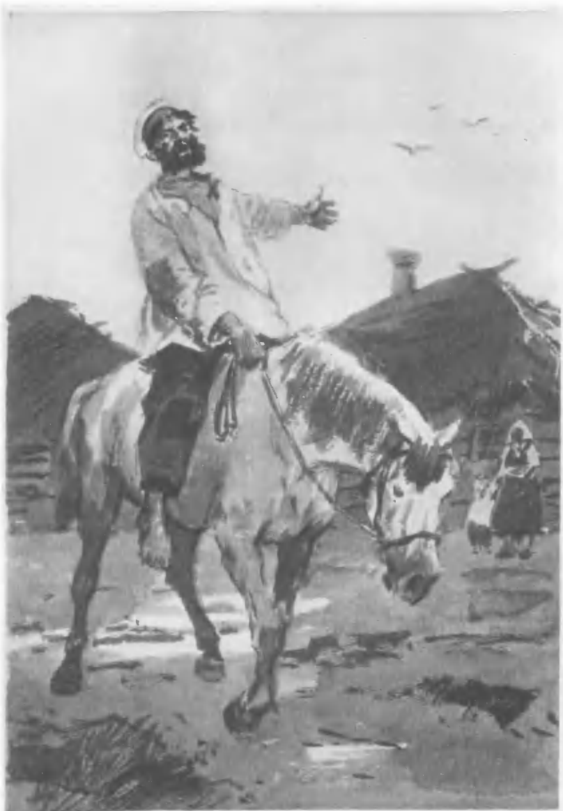
«ГЛАВНЫЙ БАРИН» (стр. 18).